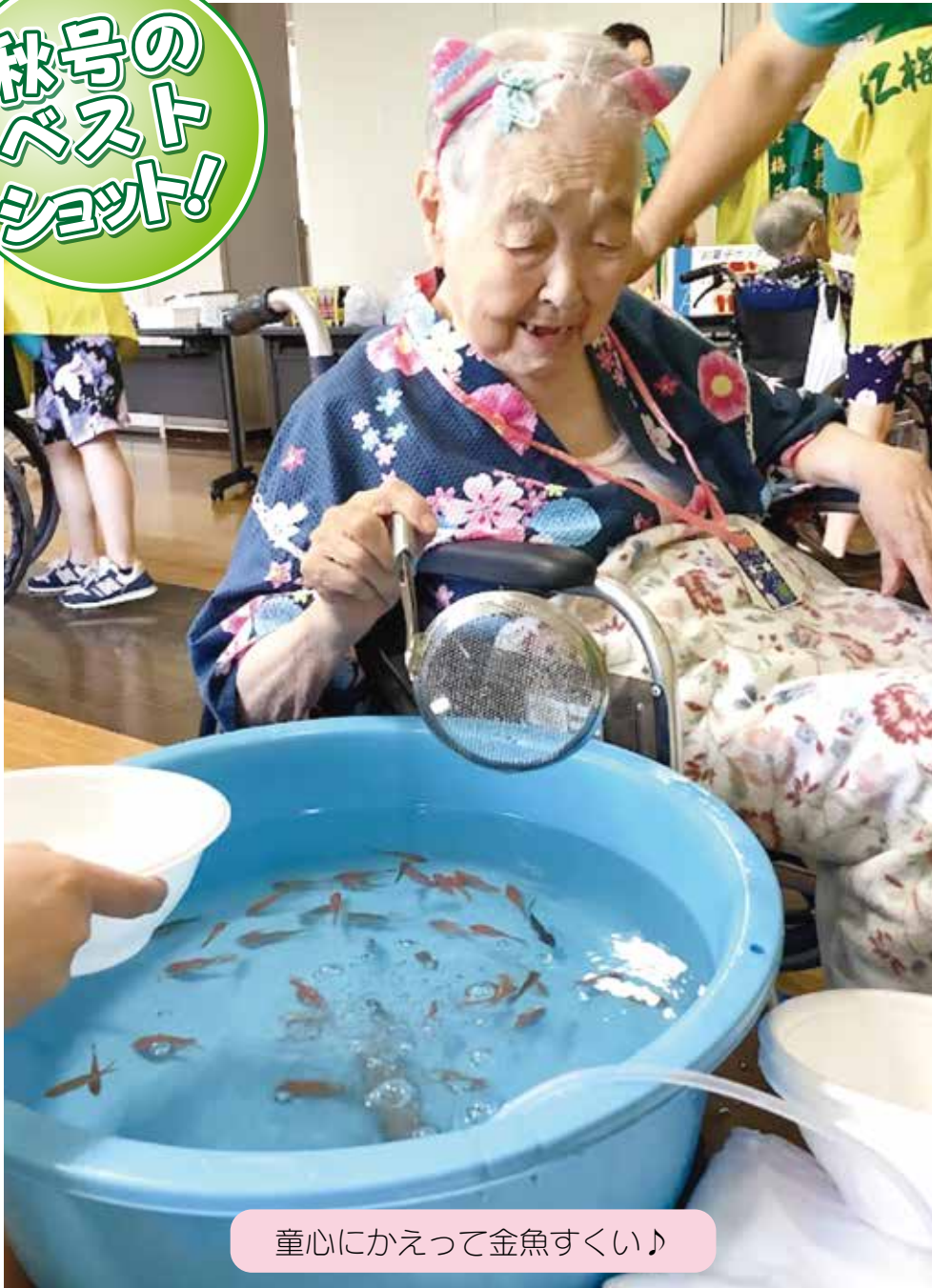
童心にかえて金魚すくい♪