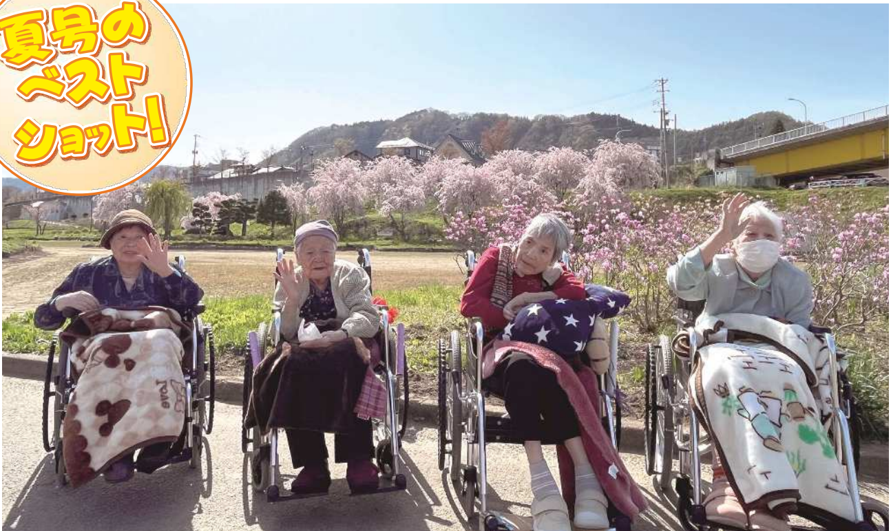
みんなでお花見しました!