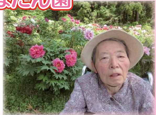
お花見もぼたん園も 天気が良くて 良い気持ちでした♪