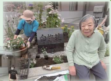
みんなでお花を植 えました～★