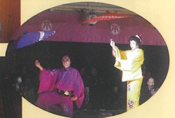
秋田県康楽館にてお芝居を楽しんできました。