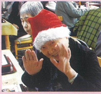
おいしいご馳走ありがとう