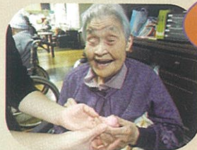
手際のおい 女性陣