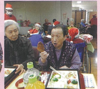
あいや！おっきい肉！