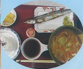
炭火焼サンマは最高！