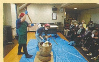
「よいしょ」の声援でおいしいお餅ができました。良い年を迎えられます。