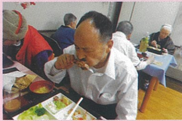
かじりつくなのが美味いんだよな