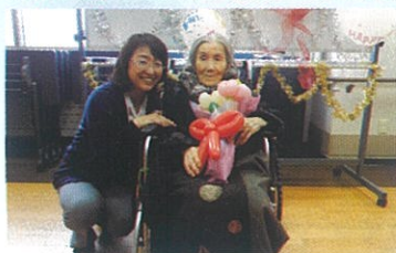
11月14日 103歳の誕生日を迎えられました。これからも楽しく過ごしましょうね☆