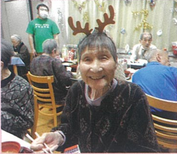
可愛らしいトナカイさん