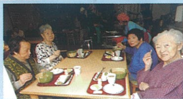
このサンマのワタが美味いんだよなあ