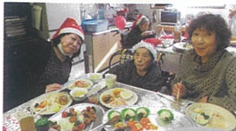
メリークリスマス☆