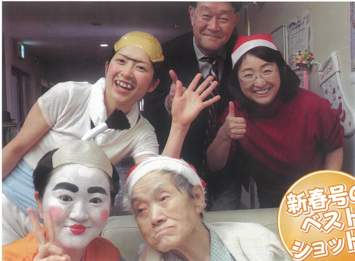
仮装でメリークリスマス♪