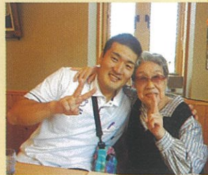
連れてきてくれてありがとう♥