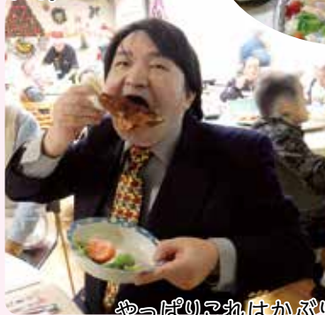
やっぱりお物はかぶりつかないとね♪