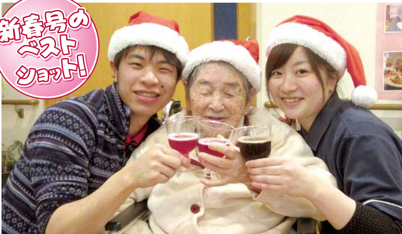
「メリークリスマス!乾杯!」