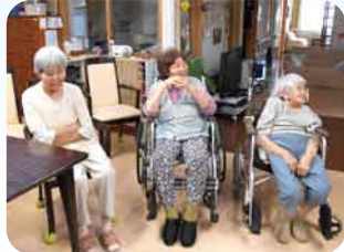
最後には皆さん笑顔 と大きな拍手で終了しました。