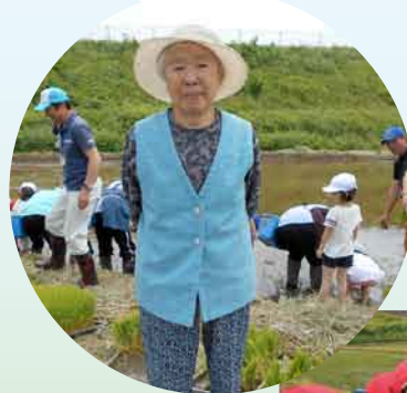
はじめて、地域 (金田一)の田植え を見学しました。