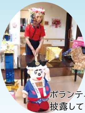
ボランティアで大道芸を披露してくださいました。