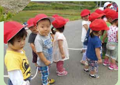
可愛らしい園児たちの姿も… 田植えの思い出話して笑顔になり、子供たちを見てまたまた笑顔と、楽しいひと時でした。