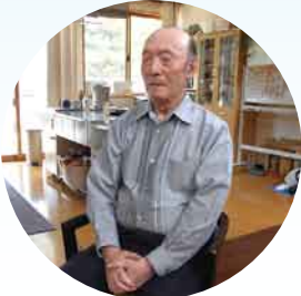
踊りの得意なS様は… ?マーク