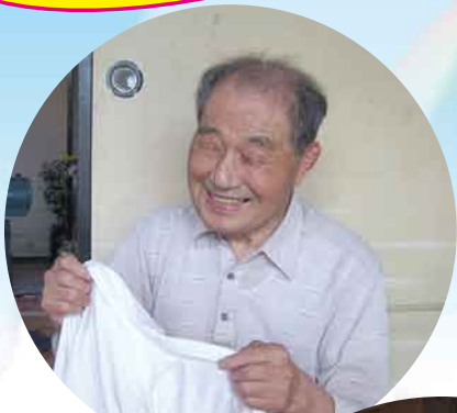
ヘルパーは、 いつも素敵な 笑顔に メロメロ!